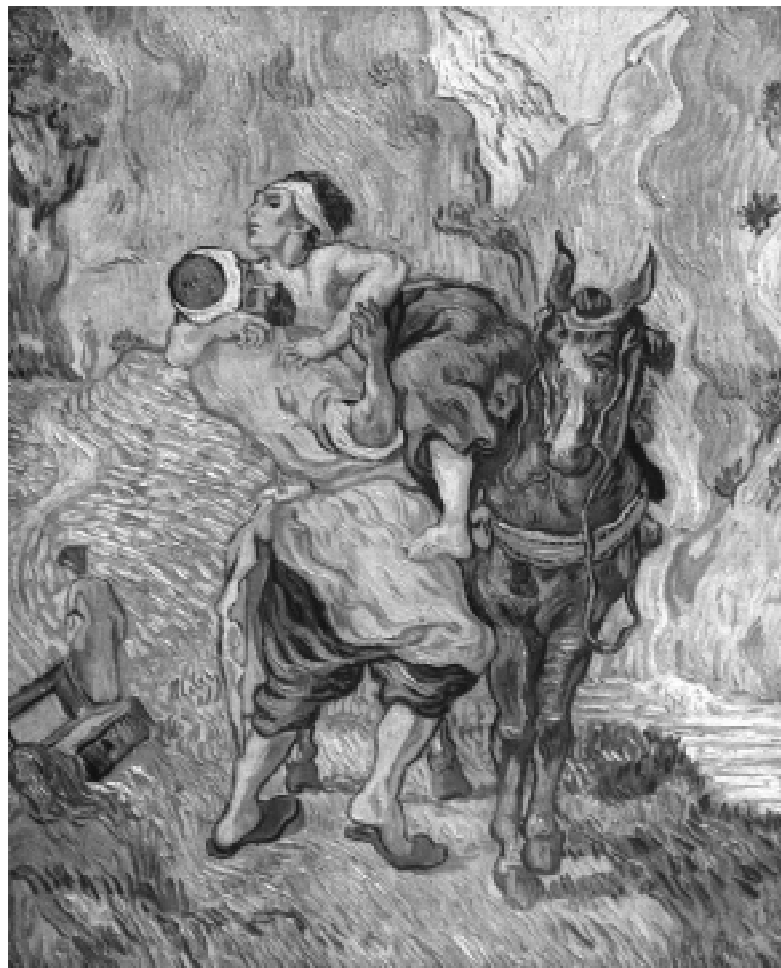
Vincent Willem van Gogh: Der barmherzige Samariter, (1890)

Das Gebot der Nächstenliebe gilt nicht uneingeschränkt und grenzenlos, sondern ist eingebettet zwischen zwei Einschränkungen: 1. An erster Stelle steht die Liebe zu Gott! und 2. Jeder soll auch sich selber lieben, achten, wertschätzen. Auf Gott sollen wir unser ganzes Vertrauen richten, sollen von ihm alle Hilfe und Gnade erwarten und sollen uns an seinem Willen orientieren. Und es gilt auch: Die Liebe zum Nächsten findet seine Richtschnur an dem, was wir uns selber wünschen, was wir leisten können und wo unsere Grenzen erreicht sind. „Liebe deinen Nächsten – wie dich selbst.“ – nicht mehr, aber eben auch nicht weniger. Mit diesem Gebot, also dieser guten Handlungsanweisung Gottes, können wir geduldiger zuhören, besonnener reden, hilfsbereiter zupacken, freundlicher reagieren und mehr Zeit einplanen für den Nächsten, der uns gegenübertritt: Passanten auf der Straße, Leute mit denen wir zusammen Bus fahren, Nachbar oder Nachbarin, aber auch Familienmitglieder oder gute Freunde. Das sind unsere Nächsten, denen unsere Liebe gelten soll.